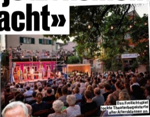
Das Freilichtspiel lockte Theaterbegeisterte aller Altersklassen an.